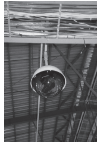
Die ArbeiterInnen von Chi Fung stehen unter ständiger Kameraüberwachung.

Die CIR hat einige Kopien der Reportage auf VHS. Bitte fragen Sie bei Interesse telefonisch unter 0251-89503 bei uns an!