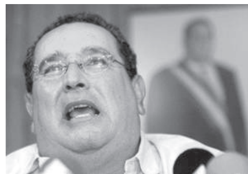
Alemán ist nicht nur ein dicker Freund des Präsidenten der Dominikanischen Republik. Er besitzt dort auch viele Ländereien. Ein Teil seiner Familie hat sich bereits in Richtung DomRep vom Ackergemacht.

Der aktuelle Präsident, Mitglied der Partei des Ex-Präsidenten und als Vizepräsident lange Zeit dessen politischer Weggefährte, kann seine Antikorruptionskampagne nur deshalb mit dem Angriff auf Alemán krönen, weil er nicht nur die betrogene