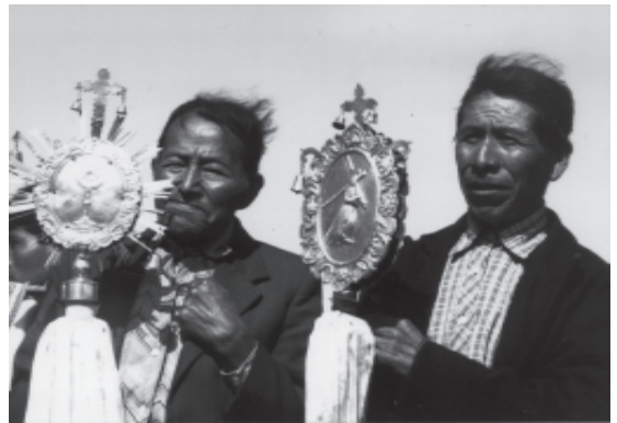
Stakeholder und internationale watchdogs der Globalisierung.

Hochrangige Vertreter aller Religionsgemeinschaften müssten sich, möglichst gemeinsam, auf internationaler Ebene intensiver etwa mit der Demokratisierung der WTO (Welthandelsorganisation) befassen sowie konkrete politische Positionen beispielsweise zur Stärkung der ILO (Internationale Arbeitsorganisation) und Durchsetzung grundlegender Arbeitnehmerrechte, zur Tobin-Steuer, zu Kapital-