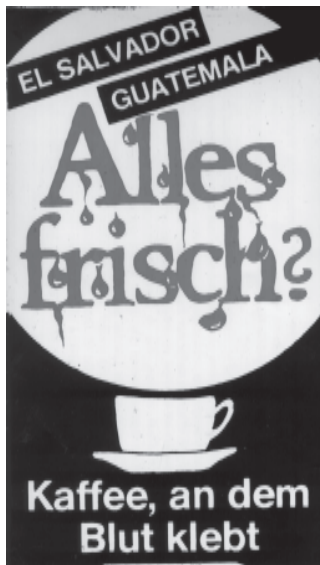
Aufkleber aus den 80er Jahren.