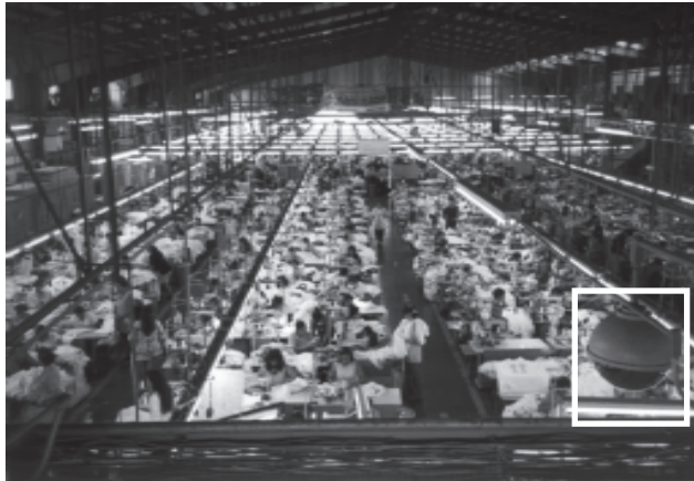
Die Maquila Chi Fung, ein Zulieferer von adidas, stand in den letzten Monaten im Zentrum der Kritik der Kampagne für 'Saubere' Kleidung.

keine Zeit zu verlieren. Der geringen Löhne wegen versuchen sie, das Produktionssoll zu schaffen, um einen Zuschlag zu erhalten. Diese Form des Drucks scheint dem Management aber nicht auszureichen: Die ArbeiterInnen