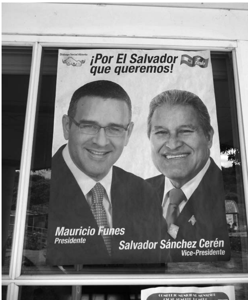
Steht einer Regierung der leeren Kassen vor: Präsident Mauricio Funes (li.)

starke Verankerung in der Bevölkerung, und das nicht nur in der Unterschicht. Ein großer Teil der FMLN-Wähler stammt aus den städtischen Mittelschichten. Deren Anliegen waren vor allem die Stärkung der Rechtssicherheit und eine längst ausstehende Modernisierung