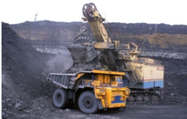
Raus aus der Kohle – eine Forderung der Divestment-Bewegung

Denn „unsere“ Kirchen und Bistümer, Kommunen, Städte, Universitäten und Pensionskassen investieren ihr und unser Vermögen in die fossile Wirtschaft. Als Mitglied von Kirchengemeinden, als Rentner und auch als Bürger profitieren wir also von diesen Anlagen in klimaschädliche Unternehmen. Somit trägt jeder von uns ein Stück Verantwortung für die „tödliche Wirtschaft“.