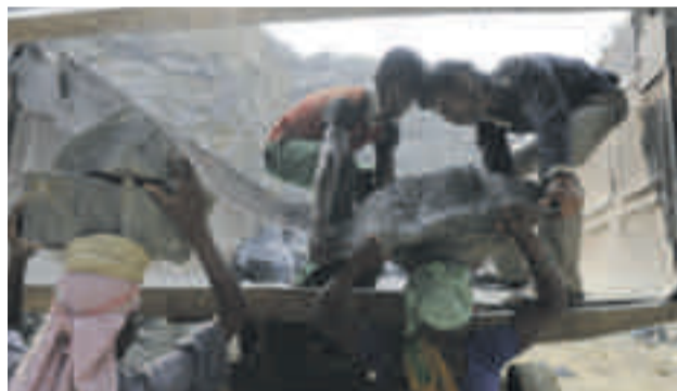
Ausbeuterische Kinderarbeit in einem indischen Steinwerk

werden weltweit durch Monokulturen, Bergbau, Stahlwerke und Fabrikanlagen verwüstet. Giftige Abwässer aus Minen und der industriellen Land-