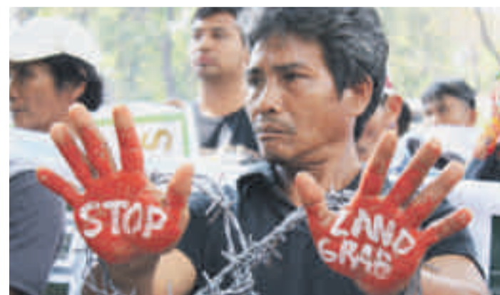
Protestaktion gegen Landgrabbing in den Philippinen