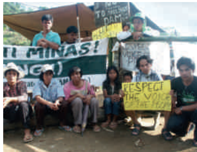
Indigene protestieren gegen die Didipio Goldmine des australischen Bergbaukonzerns Oceana Gold in den Philippinen.

Als Ecuador und Südafrika 2014 einen neuen Anlauf unternahmen, im UN-Menschenrechtsrat ein verbindliches Abkommen auszuhandeln, machte die Wirtschaft mobil. Doch aller Lobbyarbeit zum Trotz wurde die Einrichtung einer zwischenstaatlichen Arbeitsgruppe zur Erstellung des Abkommens beschlossen. Daraufhin machten die Wirtschaftsverbände eine taktische Kehrtwende. Sie kündigten an, sich an den Diskussionen in der Arbeitsgruppe zu beteiligen. Wenn sich Wirtschaft und Industrieländer heraushielten, so die Befürchtung, könnte sich