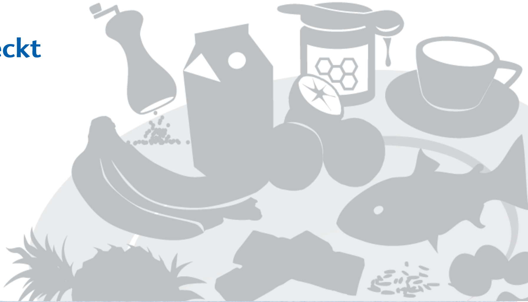
Illustration: Marco Fischer